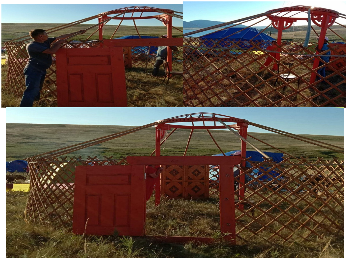
Рис. 1. Сборка традиционной тувинской юрты

Стены юрты образует деревянный каркас из 6 (или больше) звеньев складной решетки, установленных вертикально по кругу. Крыша — куполообразная, из тонких длинных палок, привязанных одним концом к решетке, а другим вставленных в деревянный круг, служащий одновременно и дымовым отверстием. В зависимости от ширины раздвижения звеньев решетки стены юрты могут быть выше или ниже.