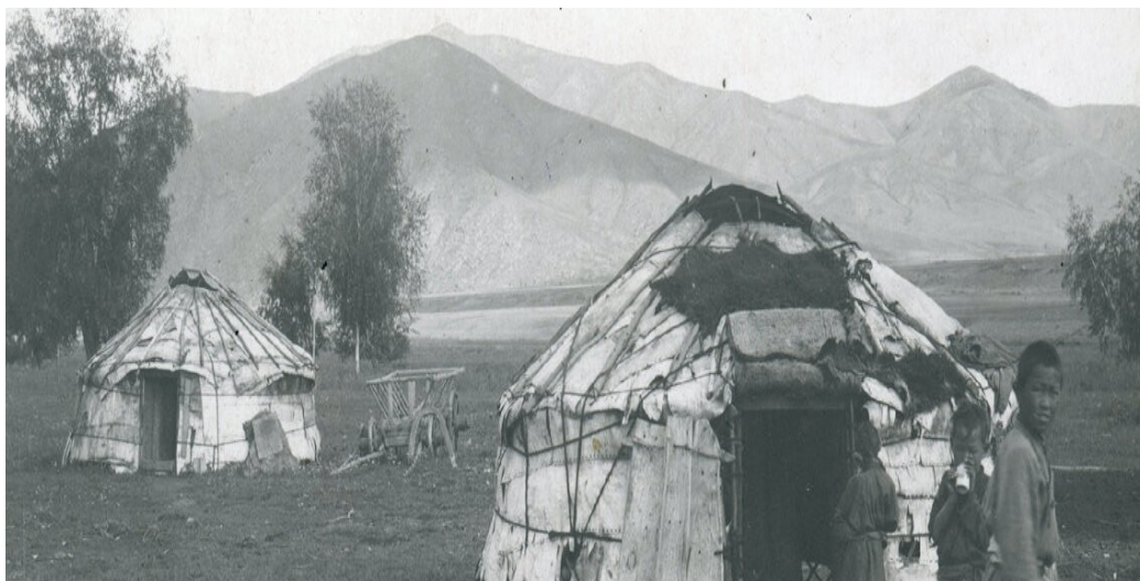
Рис. 3. Юрта бедняка, крытая берестой, 1935 г.

Бедняцкие юрты покрывали коричневым или серым войлоком, служившим до полного износа. Деревянная утварь была бедная и самодельная, на земляном полу вместо войлока лежали куски бересты. Однако и такая юрта была доступна не каждому: многие жили в маленьких конических шалашах-чумах, покрытых ветхим войлоком. Основу таких шалашей составляли палки, связанные вверху в пучок или вставленные в деревянный дымовой круг (хараача), а внизу расставленные по кругу. Называлось такое жилище «боодей».